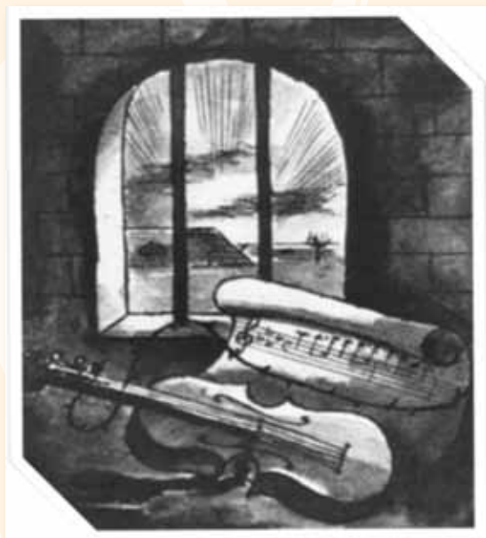
בדד'ך פריטה, "טבע דומם"

הפרויקט משותף לבית טרזין ולעמותת ”נשימה”.