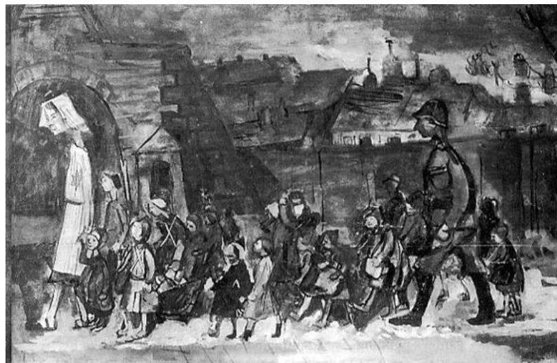
אוטו אונגר, טרנספורט ילדים, טרזיינשטאט, 1943

השמועות שנפוצו בגטו בעקבות הגעת ילדי ביאליסטוק זעזעו את כל האסירים כפי שמסתבר גם מאירוי בכירי הציירים, שהסתכנו לצייר את הגעת הילדים לגטו, במחתרת.