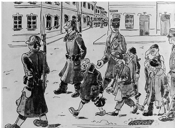
ארנסט מורגן – ילדי ביאליסטוק בטרזיינשטאט