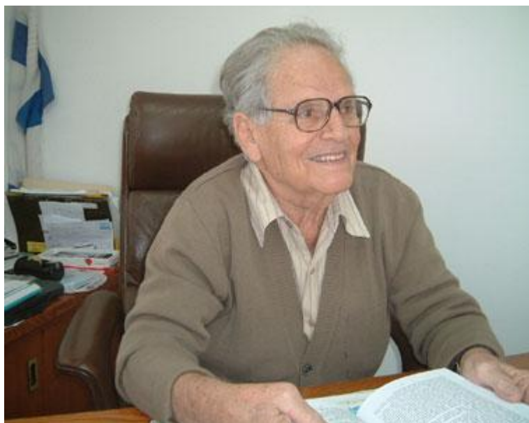
פטר ארבן היום

לכבוד אימו הקיסרית מריה טרזה בנה בשנות ה-80 של המאה ה-17 קיסר אוסטרו הונגריה, יוזף השני, עיר מבצר קטנה באיזור יפיפה כשישים ק"מ מפראג. טרזין (עירה של טרזה בצ'כית (בבנתה מוקפת בחומה בכוונה למנוע פלישה של צבא פרוסיה, כשכל גודלה כק"מ מרובע. זמן קצר אחרי פלישת הנאצים לצ'כיה ב-39' הציע היידריך שהעיר תשמש כמחנה מעבר ליהודים הצ'כים ואלה מהמדינות השכנות בדרכם לאושוויץ ומחנות ריכוז אחרים במזרח. בין ה-23 בנובמבר '41, היום בו הגיע המשלוח הראשון לטרזין וה-8 במאי '45 – היום בו שוחרר המחנה – עברו בו כ-140 אלף יהודים, מתוכם שרדו כ-19 אלף. הגטו לא דמה לשום מחנה אחר – הוא נוהל אדמיניסטרטיבית באופן טוטאלי ע"י יהודים ולכן הפך לגטו לדוגמא. כשרצו הנאצים להראות לצלב האדום שהיהודים זוכים ליחס טוב הביאו אותם לטרזין. "יש דרגות בגיהנום, וטרזין היא דרגה טובה יחסית" אומר חוקר השואה והמחזאי קובי לוריה, ואכן יחסית לגטאות ברשה, לודג' וכדומה ולמרות הצפיפות האיומה (עשרות אלפים שחיו בק"מ מרובע) והרעב - מצב היהודים היה נסבל מעט יותר. השלטון העצמי היהודי איפשר הרבה חיי תרבות מגוונים – תאטרון, מוסיקה (בעיקר ידוע פועלו של קרל שווינק, איש הקברט שפעל בטרזין) – וגם ספורט. וכמו תמיד איש אחד עם חזון עשה את כל ההבדל.